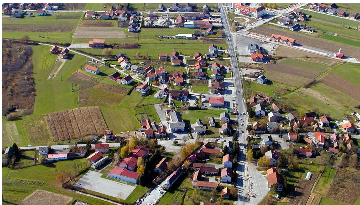
Slika 2. Prikaz Općine Klinča Sela

Povećanje blagostanja lokalne zajednice osnovna je svrha svakog društveno-ekonomskog razvoja. Kad je riječ o Općini Klinča Sela, povećanje blagostanja lokalne zajednice podrazumijeva dobro osmišljeno i međusobno koordinirano aktiviranje cjelokupne raspoložive materijalne i nematerijalne resursne osnove kojom Općina raspolaže. Rast društveno-ekonomskog blagostanja Općine Klinča Sela pretpostavlja i upravljanje gospodarskim rastom i razvojem na principima dugoročne ekonomske, socijalne i ekološke održivosti. Dugoročna ekonomska, socijalna i prostorno-ekološka razvojna održivost nekog prostora podrazumijevaju gospodarski rast i razvoj koji zadovoljava potrebe sadašnjih stanovnika na način koji ne ugrožava budućnost budućih generacija, ali i koji u okviru prihvatnog kapaciteta eko i društvenog sustava unaprjeđuje kvalitetu života lokalnih žitelja. Da bi to bilo moguće, poželjni društveno-ekonomski razvoj Općine Klinča Sela nameće potrebu za razvoj i unaprjeđenje infrastrukture, razvoj društvene infrastrukture, poticanje razvoja poduzetništva i poljoprivredne proizvodnje, razvoj turizma, zaštitu i očuvanje vodnih resursa kao i gospodarenje otpadom.